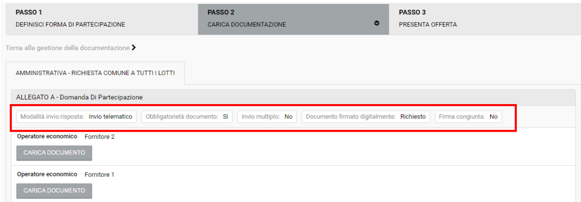
Figura 2 - Caratteristiche restituzione documento

Per le richieste con invio disgiunto, il portale indica a quale azienda del raggruppamento esse fanno riferimento